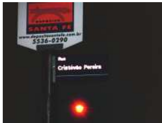
Fig 06 – “Cristóvão Pereira”, simitério de tocos – malditos!!

porta malas que nada, entro de toco e tudo no banco da frente. Erick pisa no pedal da direita e deixa os temores para trás. Podemos comemorar.