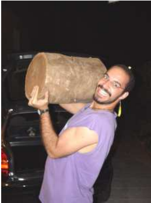
Fig 12 – Tava pesadinho.

Ainda sobrou pique para voltarmos em cada uma das cenas do crime e tirarmos fotos para poder escrever este artigo que, se não ajudar alguém a conseguir tocos para armoria, espero que tenha ao menos o divertido.