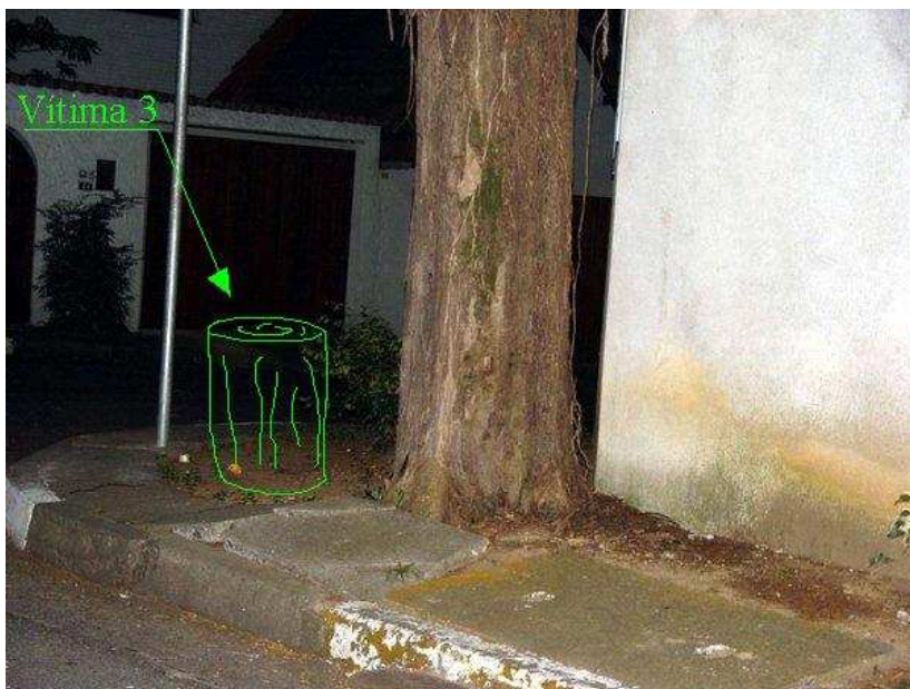
Fig 09 – Local do crime 3.

E além do mais, não tinha NENHUM guardinha na guarita. E além de tudo isso, tinha um toco PERFEITO dando sopa (fig. 08 e 09). Hum, é para uma boa causa. Paramos. Com a experiência adquirida com as outras duas conquistas, fomos rápidos e precisos. Em 1 minuto o toco repousava ao lado de seu colega no maleiro.