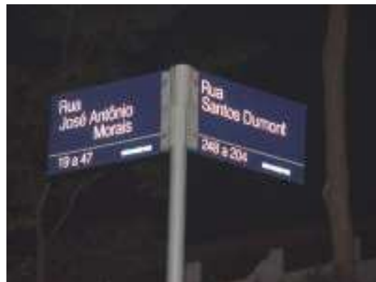
Fig 07– Rua do crime 3.

Já a caminho da casa do Erick, ele me mostrou um lugar onde havia visto uns tocos outro dia, mas não estavam mais lá. Resolvemos dar uns passeios pelo bairro. Quem sabe não achávamos outros deste tipo.