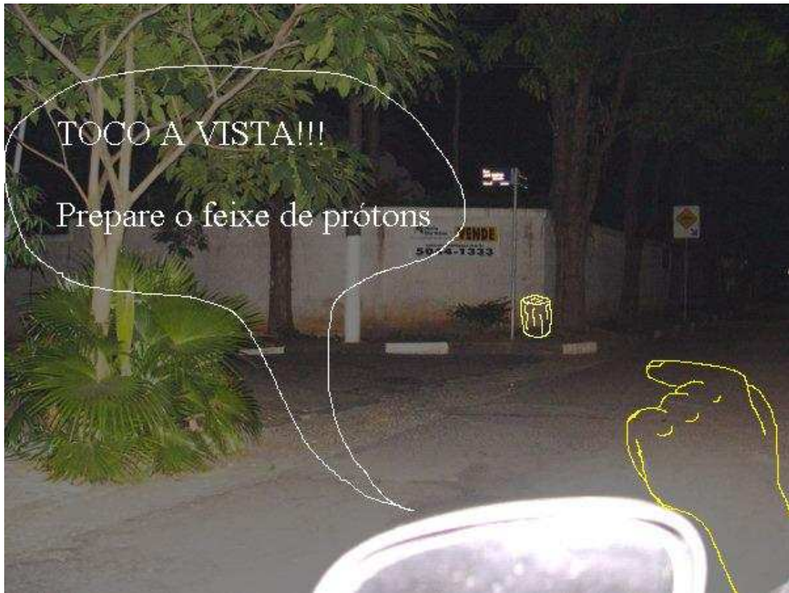
Fig 08 – Caça-Tocos em ação, avistando a vítima 3.