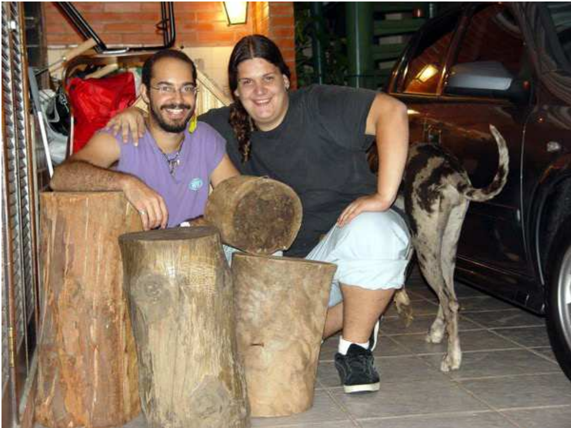
Fig 13 – Nós e as belezinhas, só faltou hidromel.

Ainda sobrou pique para voltarmos em cada uma das cenas do crime e tirarmos fotos para poder escrever este artigo que, se não ajudar alguém a conseguir tocos para armoria, espero que tenha ao menos o divertido.