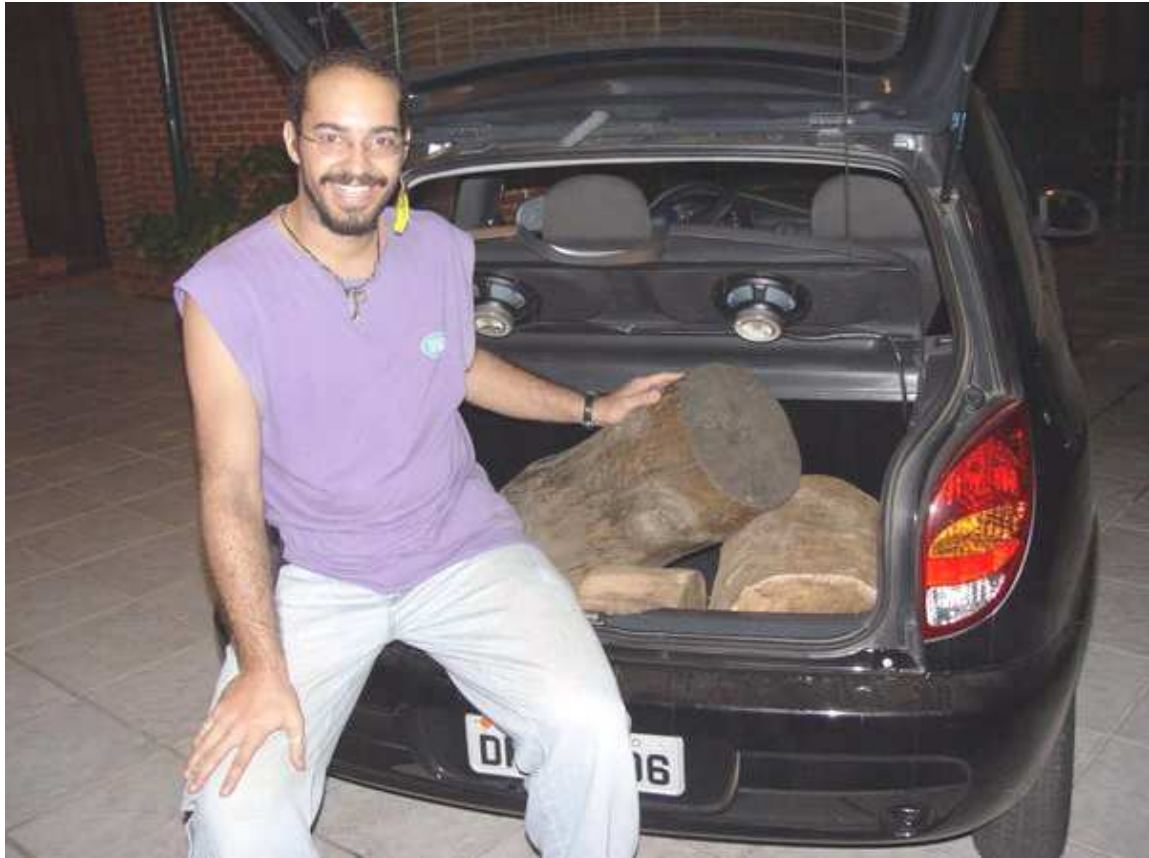
Fig 10 – Carro carregado, preparando para esvaziar as armadilhas.