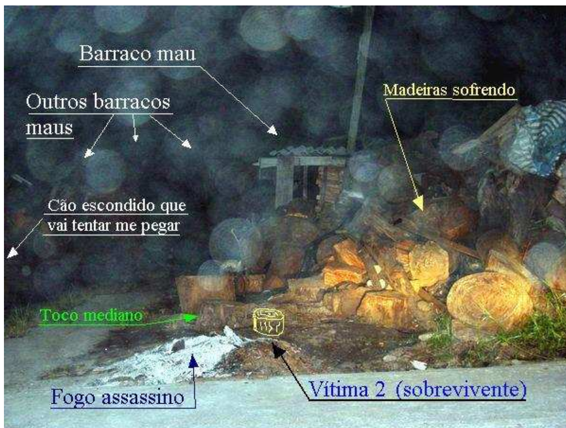
Fig 05 – Zoom do “simitério” com toda a topologia do lugar.