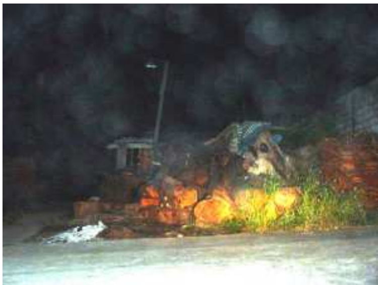
Fig 04 – O grande “simitério” de tocos.

carcomidas de alguns tocos jazidos na terra – poderiam ter feito um enterro decente pelo menos, malditos!!! (fig. 04).